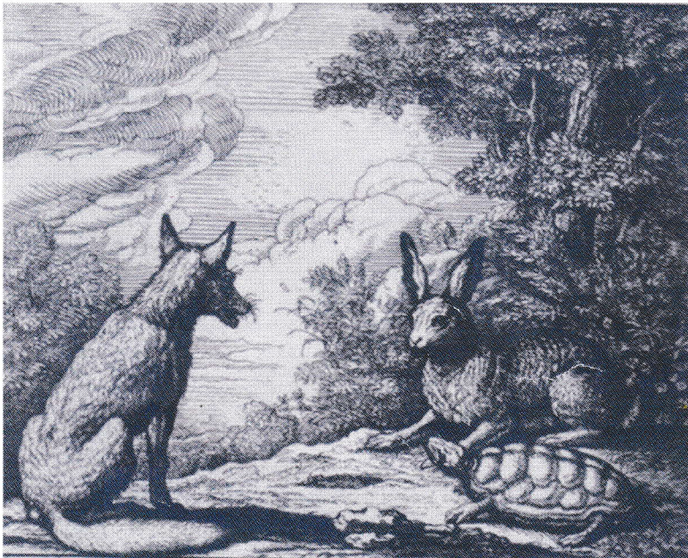
Du Lièvre et de la Tortue, tiré de F. BARLOUW, Fables d'Ésope avec des figures dessinées et gravées, Amsterdam, 1714.

ÉSOPE, Fables choisies , traduites par une société de professeurs et d'hellénistes, Hachette, Paris, 1869.